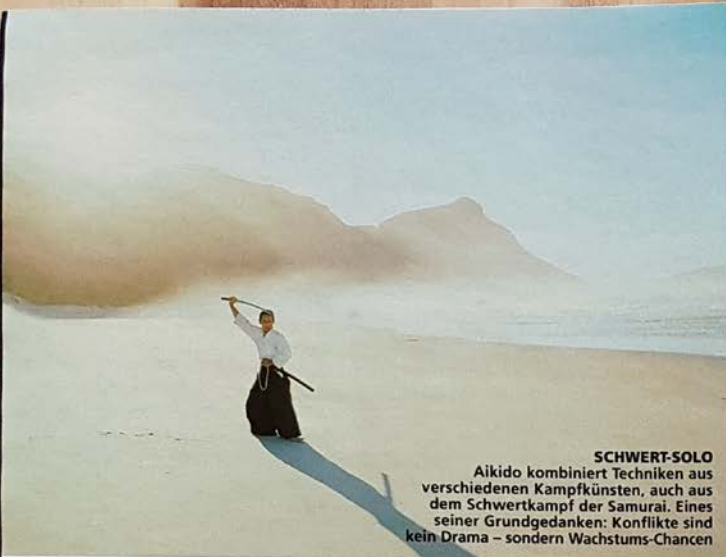
SCHWERT-SOLO Aikido kombiniert Techniken aus verschiedenen Kampfkünsten, auch aus dem Schwertkampf der Samurai. Eines seiner Grundgedanken: Konflikte sind kein Drama – sondern Wachstums-Chancen