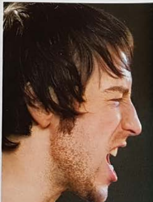
DEESKALATION Aikido ist auch geistiges Training – seine Techniken helfen, klassische Fehler bei Partnerkonflikten (wie gegenseitiges Anschreien) zu vermeiden. Ganz oben: funktioniert auch im Büro – der »Aikido-Stil«

3. Unser Gehirn entscheidet in dieser Situation der körperlichen Erschöpfung, dass aktiver Widerstand jetzt sinnlos ist, und beschließt zu verhandeln. Dem Straßenträuber wird ein Geldbetrag angeboten, dem Kollegen oder Partner ein Kompromiss.